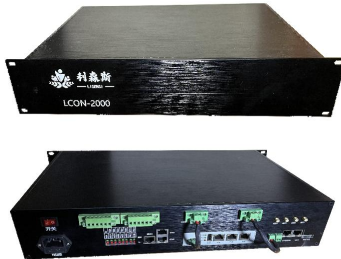
智能采控终端（多合一5G版）